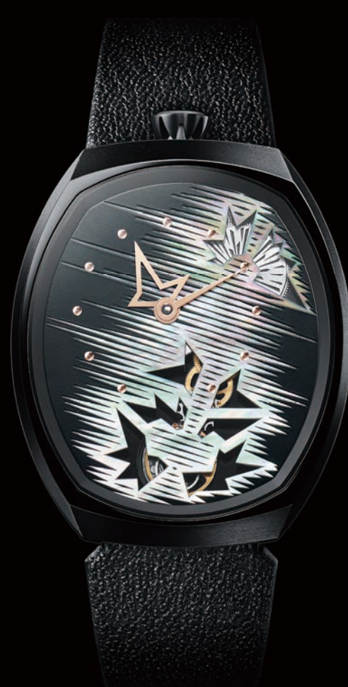
FIONA KRÜGER : TASAKI CHAOS P26 - P27