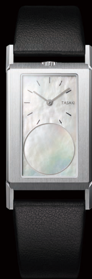
FACE OF TASAKI P17 - P21