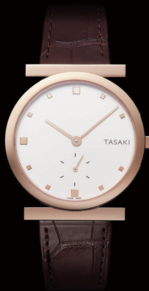
balance MEN'S / WOMEN'S P04 - P16