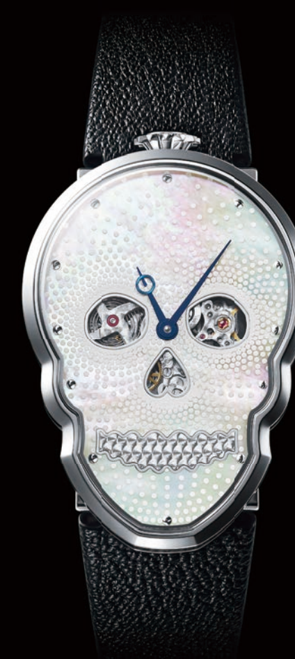
FIONA KRÜGER : TASAKI PETIT SKULL P22 - P25