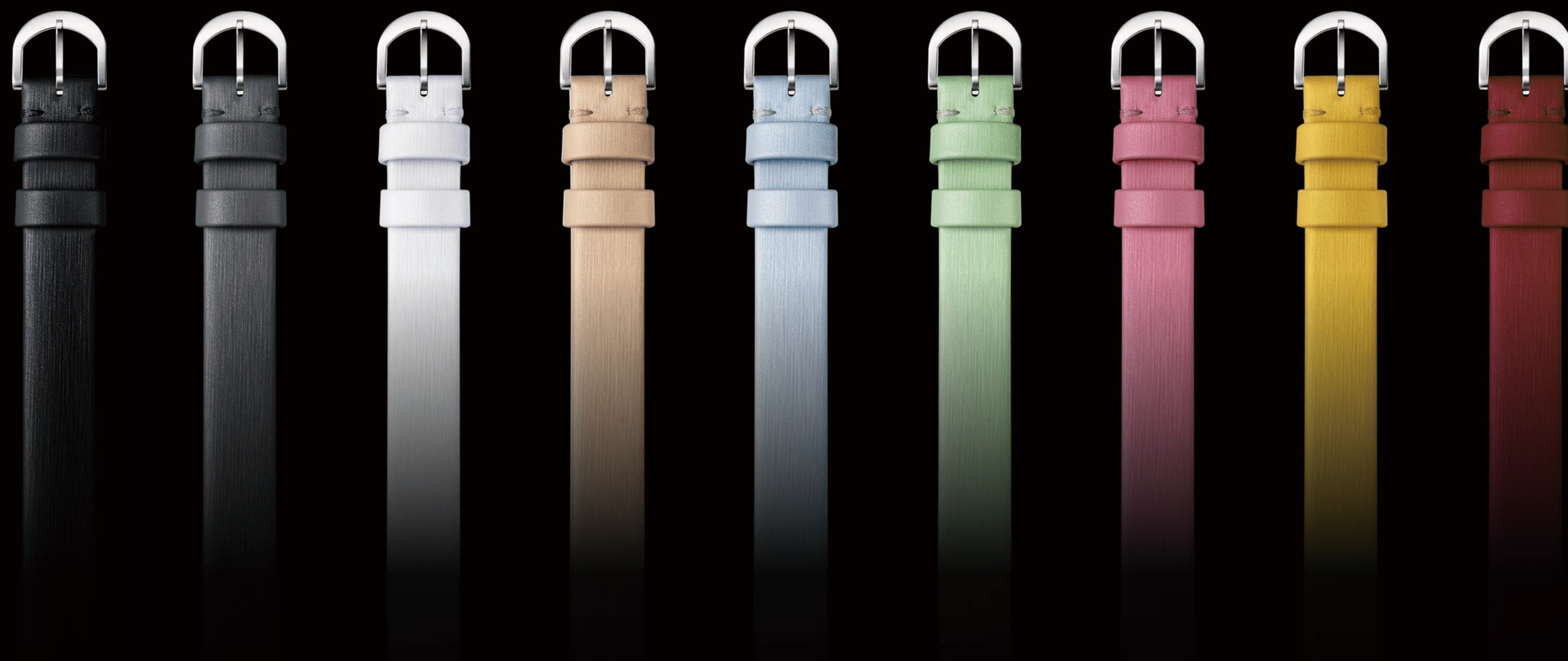
インターチェンジャブルストラップ (ステンレススティール製バックル付き)