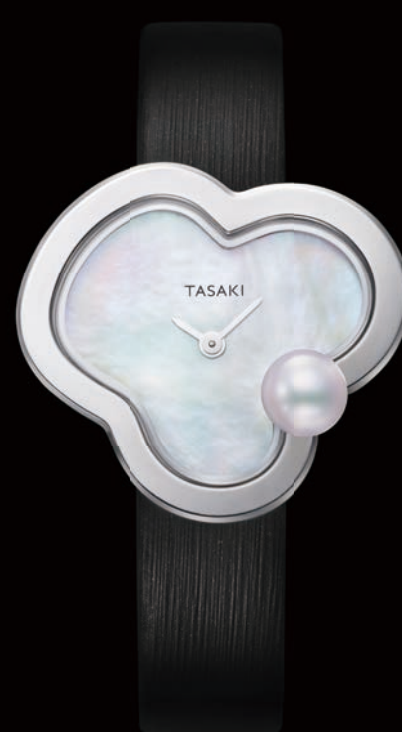
chants P28 - P30